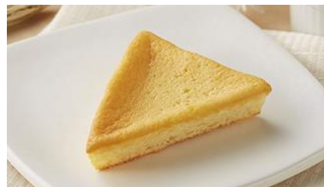
※画像はイメージです