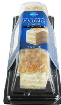
■「大人 Dolce グランデ・ブルボンバニラ」

販売エリア：全国 税抜き希望小売価格：220円（沖縄のみ260円） 税込希望小売価格：237円（沖縄のみ280円）