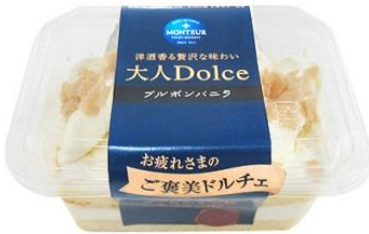
■「大人 Dolce・ブルボンバニラ」

バニラビーンズの鞘の大きさにもこだわり、ふくよかで品のある香りの特徴を持つフランス領レユニオン島産の希少なブルボンバニラ※を使い、洋酒と組み合わせてたっぷりバニラの味わいが楽しめるバニラづくしのケーキに仕立てました。個食と2、3人で分け合える大きさの2種類を展開し、雪をイメージさせる真っ白なケーキはおやつシーンを冬らしく演出します。